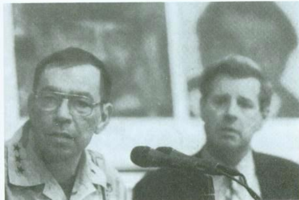
سانشينز وبريمر يعلنان عن القبض على صدام، 14 كانون الأول/ديسمبر 2003